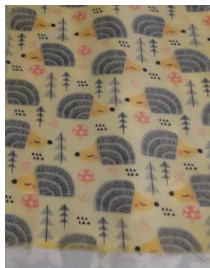
nachher mit Wachs